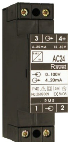
AC24 ACN24 ACN230

ACN230, ACN230/S - pomocné napájení 230V AC (aktivní výstup)