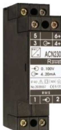
AC24/S ACN24/S ACN230/S