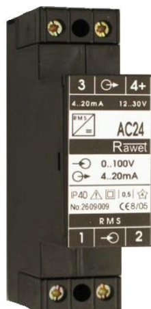
AC24 ACN24 ACN230

ACN230, ACN230/S - pomocné napájení 230V AC (aktivní výstup)