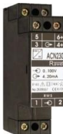
AC24/S ACN24/S ACN230/S