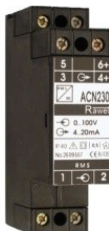
AC24/S ACN24/S ACN230/S