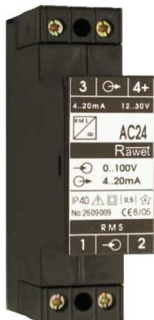
AC24 ACN24 ACN230

ACN230, ACN230/S - pomocné napájení 230V AC (aktivní výstup)